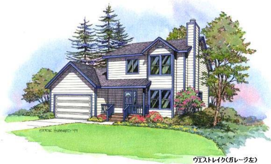
ウエストレイク(ガレージ左)