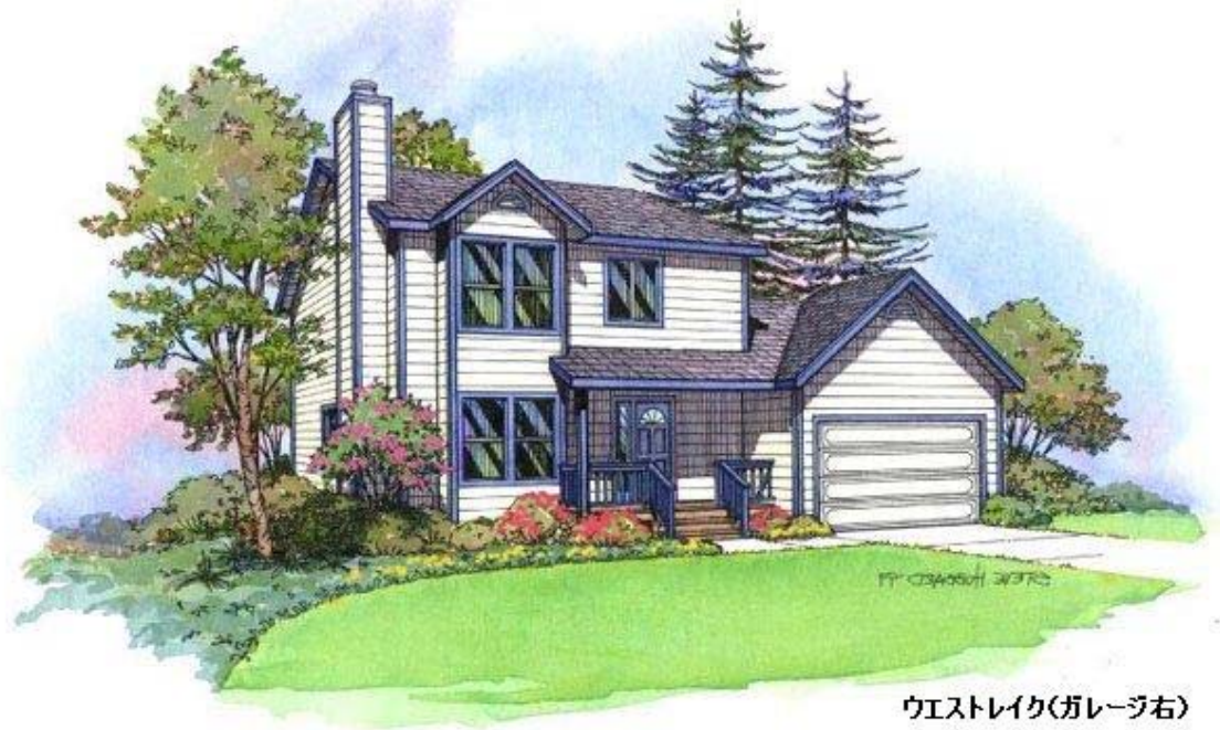
ウエストレイク(ガレージ右)