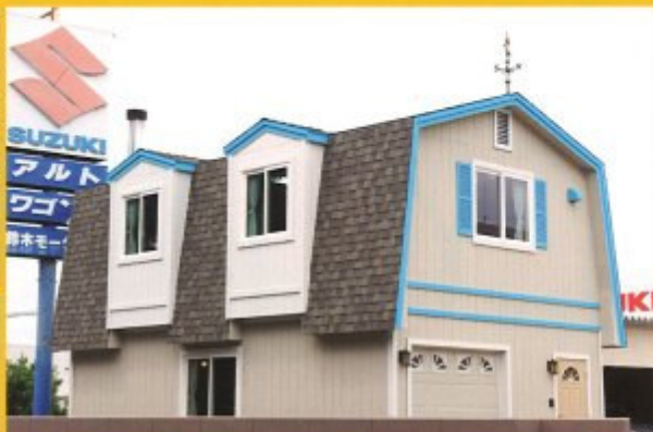
上ノ構造部分は米松(ダグラスファー)製で耐久性に優れており、断熱材は住居用のグレードを多めに使用している。躯体部分の立ち上げまでプロに任せ、塗装などは極力自力で。左ノ外壁やガレージドアは統一した色でペイントし、あまりの楽しさに作業ははかどったとか。アメリカ製オーバーヘッドドアの前は浜砂利と石畳で熊野古道のイメージにした。