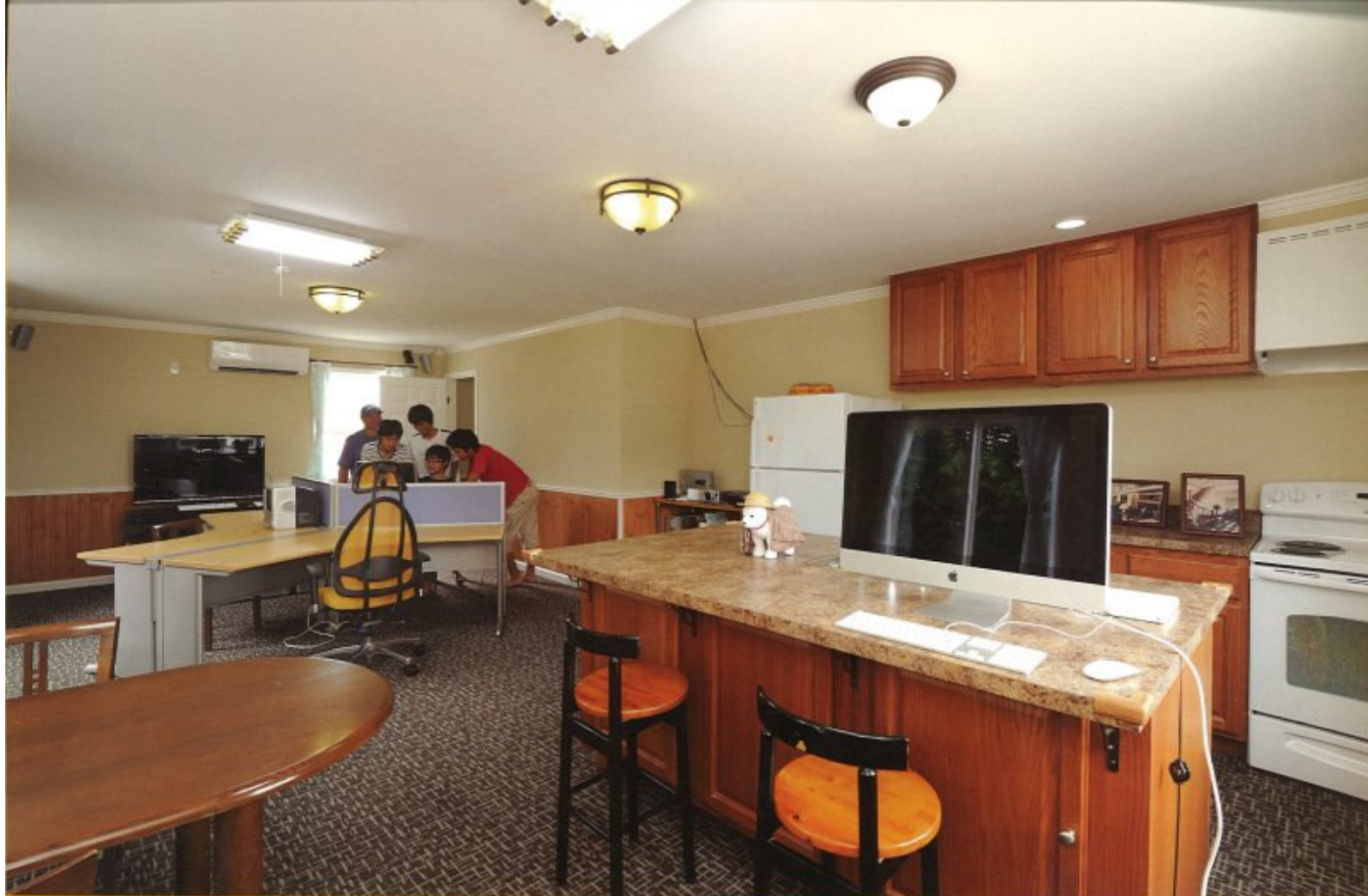
2階にはアメリカ製キッチン、オーディオ、プロジェクター、パソコン、ゲーム機など、奥さんもお子さんも仲間と一緒に楽しめるマルチベースだ。